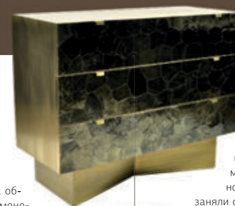
Комод из натуральной слюды, Ginger Brown