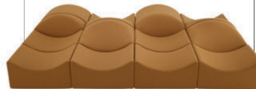
ASMARA, sofa by Bernard Govin, Ligne Roset

Предметы из прошлого, с историей придают пространству шарм, наполняют его, поэтому старая типовая советская мебель сегодня становится эксклюзивной и обретает второе дыхание. Модели, которые были придуманы знаменитыми архитекторами 50 и 100 лет назад находят своё место в галереях коллекционного дизайна и, судя по динамике, сегодня этот бизнес находится на своём пике.