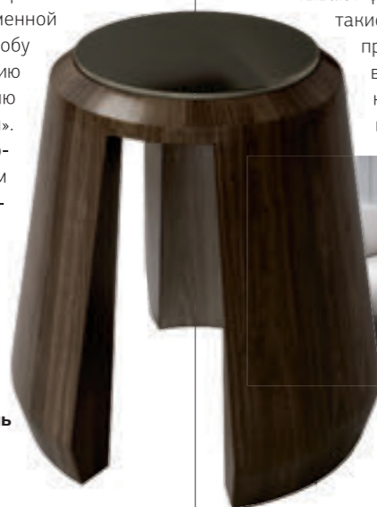
Столик Octantis, O&A London, прообразом предмета стал камень

2020 год в мире дизайна интерьеров объявлен годом возвращения к природе!