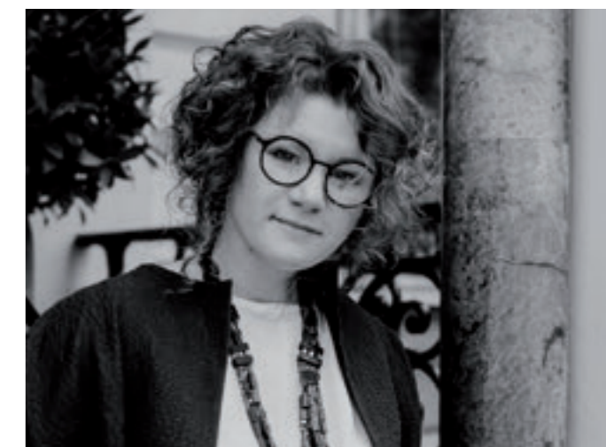
Автор: Анна АГАПОВА Креативный директор O&A Design