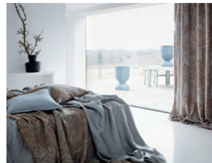
Maverick II collection, Victoria designs, De le Cuona