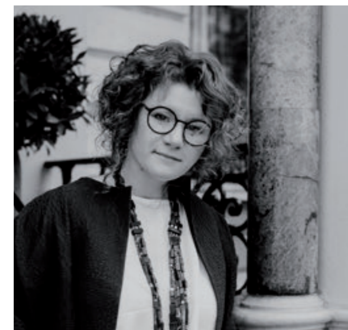
Автор: Анна АГАПОВА Креативный директор O&A Design