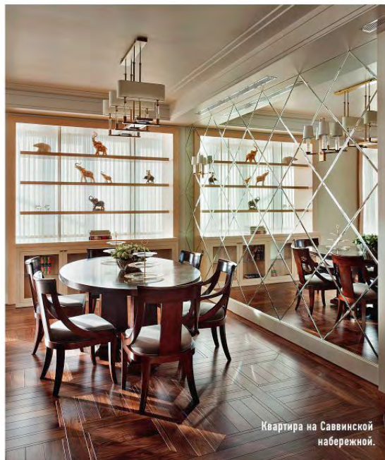
Квартира на Саввинской набережной.

уверен, что вкладываться надо скорее в интерьер. “В современной жизни человек обычно много переезжает, поэтому имеет большой смысл обзаводиться качественным и дорогим движимым имуществом, чем драгоценными стенами, которые никак нельзя взять с собой”.