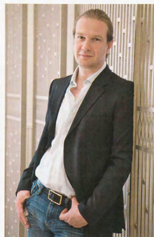
Авторы проекта Олег Клодт, Анна Агалова («Архитектурное бюро Олега Клодта»)